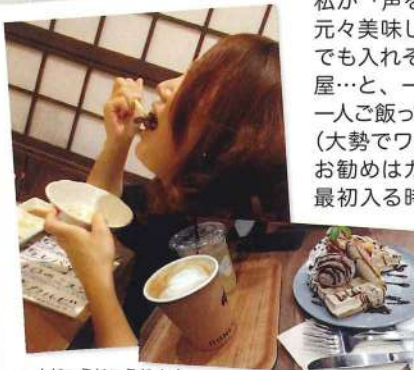
一人じゅうじゅう焼肉

各店のカレンスタッフが今皆様に「お知らせしたい・紹介したい・見せたい物」等、特に決まりを作らず担当スタッフが思うまま情報発信致します。今回は熊本店 飯島の登場です!