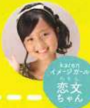
トナリ イメージ 文 恋ちゃん

各店舗に通われているLittle Ladyをご紹介するコーナー♡誌面に登場頂けるLittle Ladyも、随時募集中です!