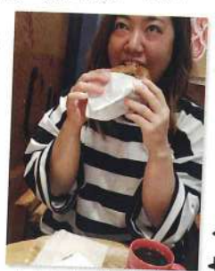
一人カフェーグルサンド

私が「声を大にして紹介したい!」事、それは...「一人ご飯のススメ!」 元々美味しい物を食べる事が大好きですが、ある日バスが来る迄時間があり、ふらっと一人でも入れそうな店を探しながら歩いていたのが最初で、それ以来吉野家・焼肉屋・居酒屋...と、一人ご飯にハマってます。 一人ご飯って、自分の好きな時に好きな物を食べられるのがいいですよね! (大勢でワイワイ賑やかに食べる事も好きなんですけど) お勧めはカウンターがあるお店。入りやすいですよ! 最初入る時は緊張しましたが、雰囲気良さそうなお店に思い切って入ってみると、お店の方から話しかけて頂けたりするので仲良くなれるし、居心地の良いやすらげるお店が発見できて楽しいです。